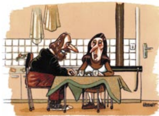
— L'avantage d'être pauvre, c'est qu'on en souffrira moins longtemps en mourant plus jeune.

Accroissement de la précarité et surtout existence, aujourd'hui, d'une seule classe sociale, cette grande bourgeoisie qu'ils auscultent depuis si longtemps : « Le vrai développement inégalitaire entre 1981 et aujourd'hui, c'est qu'on est passé d'un monde où il y avait plusieurs classes sociales à un monde où il n'y en a plus qu'une, la haute bourgeoisie. Pour les autres citoyens qui sont confrontés à un avenir incertain et à un mouvement de précarisation massif, c'est devenu chacun pour soi. » ■